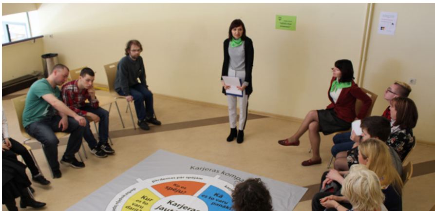
Karjeras konsultācija dalībniekiem SIVA pasākumā „Atvērto durvju diena” 2019. gadā

Aģentūras atbalsta punktā klienti var noteikt savu profesionālo piemērotību. Tas ir pirmais posms, lai varētu mācīties kādā no aģentūras izglītības iestādēm – Jūrmalas profesionālajā vidusskolā vai Sociālās integrācijas valsts aģentūras Koledžā. Nosakot profesionālo piemērotību, ar klientiem darbojas speciālisti no Jūrmalas – psihologs, ergoterapeits, ārsts, psihiatrs, karjeras konsultants, pedagogs. Pamatojoties uz klientu interesēm un speciālistu atzinumu, tiek sagatavots ieteikums kādai no izglītības vai