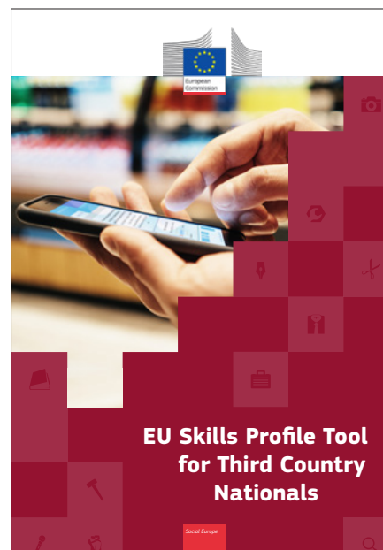
Avots: Eiropas Komisijas brošūra „EU Skills Profile Tool for Third Country Nationals”, Luksemburga: Eiropas Savienības Publikāciju birojs, 2017. gads. © Eiropas Savienība, 2020