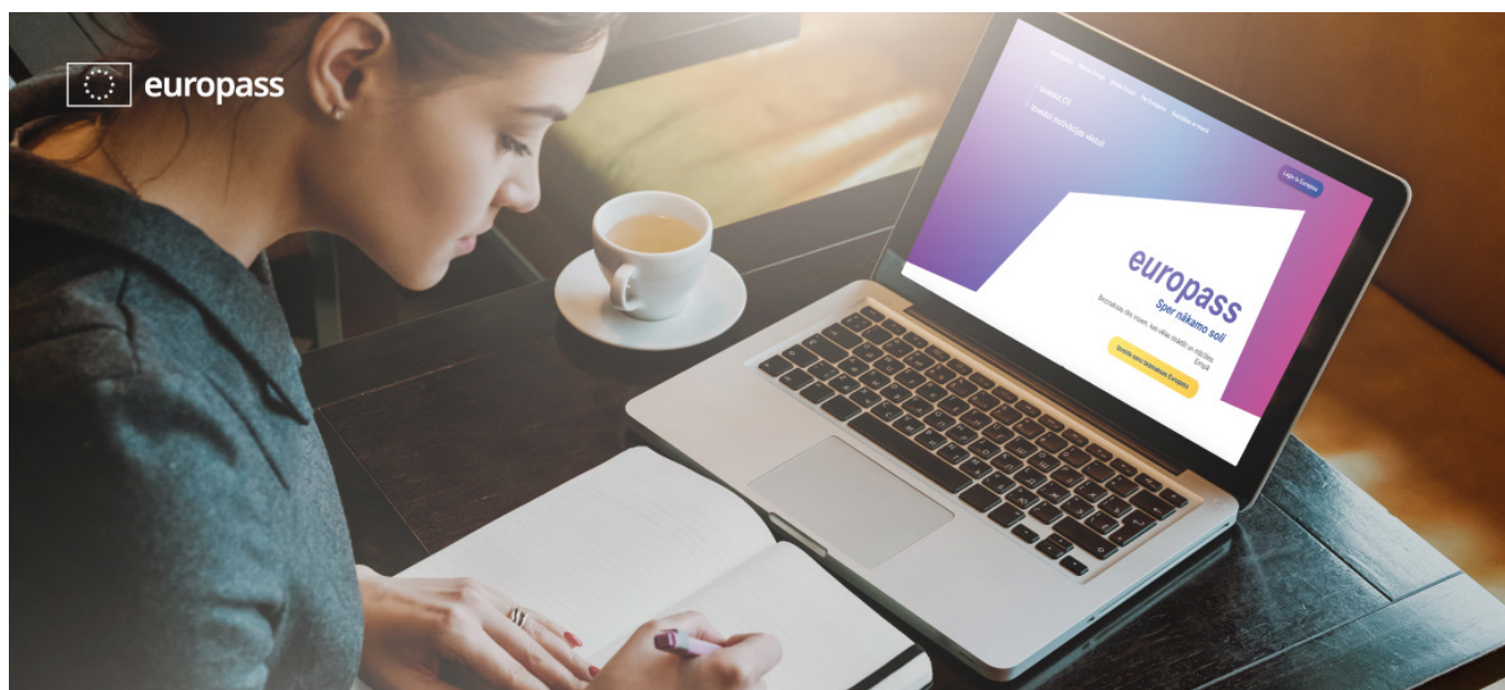
Platformai Europass – jauns izskats