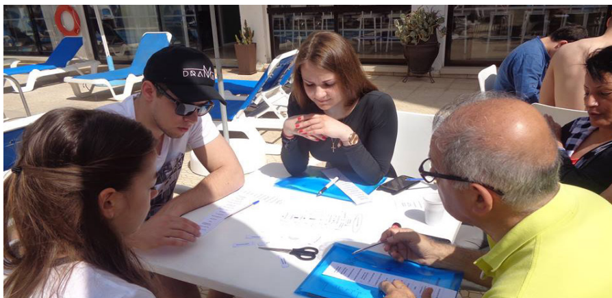
SIVA Koledžas studente piedalās Erasmus+ mācībās Kiprā 2019. gadā

Koledžas studenti un Jūrmalas profesionālās vidusskolas audzēkņi ir piedalījušies jauniešu apmaiņas programmas Erasmus+ projektos Maltā un Portugālē, kā arī starptautiskās neformālās izglītības un apmācības projektos Kiprā. Audzēkņi un studenti ir stāstījuši par savu pieredzi Jaunatnes starptautisko programmu aģentūras organizētajā konferencē „Starptautiskā dimensija jauniešu ar veselības problēmām dzīvē mūsdienās” un prezentējuši pārstāvēto tēmu „Jaunieša veselība nav šķērslis starptautiskas pieredzes iegūšanai”. Jūrmalas profesionālās vidusskolas audzēkņi piedalās Latvijas darba devēju īstenotajā projektā „Profesionālās izglītības iestāžu audzēkņu dalība darba vidē balstītās mācībās un mācību praksēs uzņēmumos”.